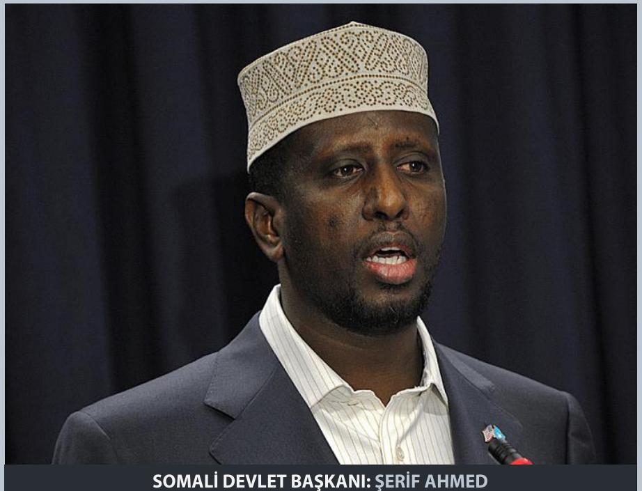
SOMALİ DEVLET BAŞKANI: ŞERİF AHMED